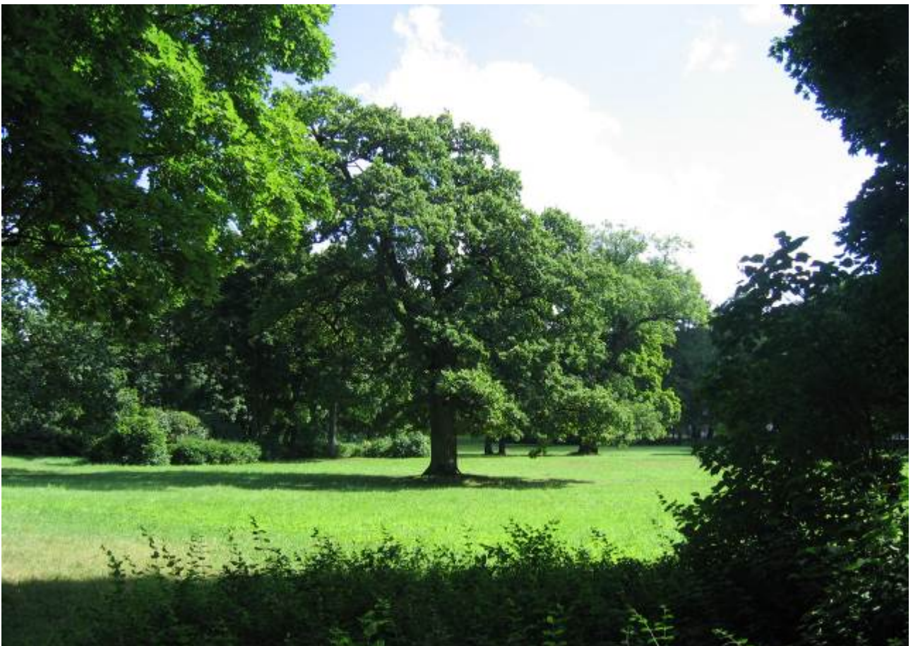
rotta verso il monumento della Russalka. 2005 - 12