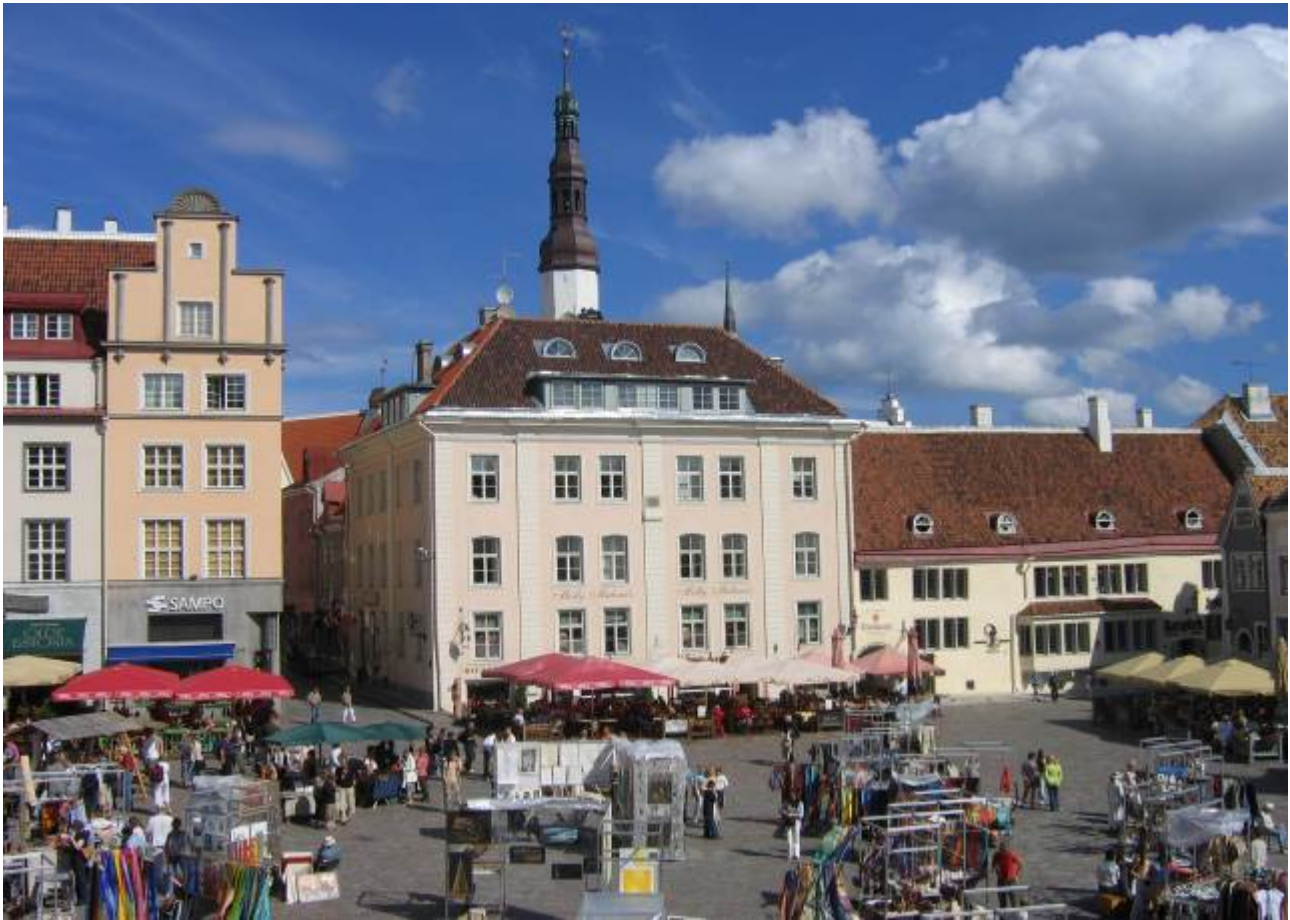
Dalle poche finestre una serie di belle vedute sulla città.