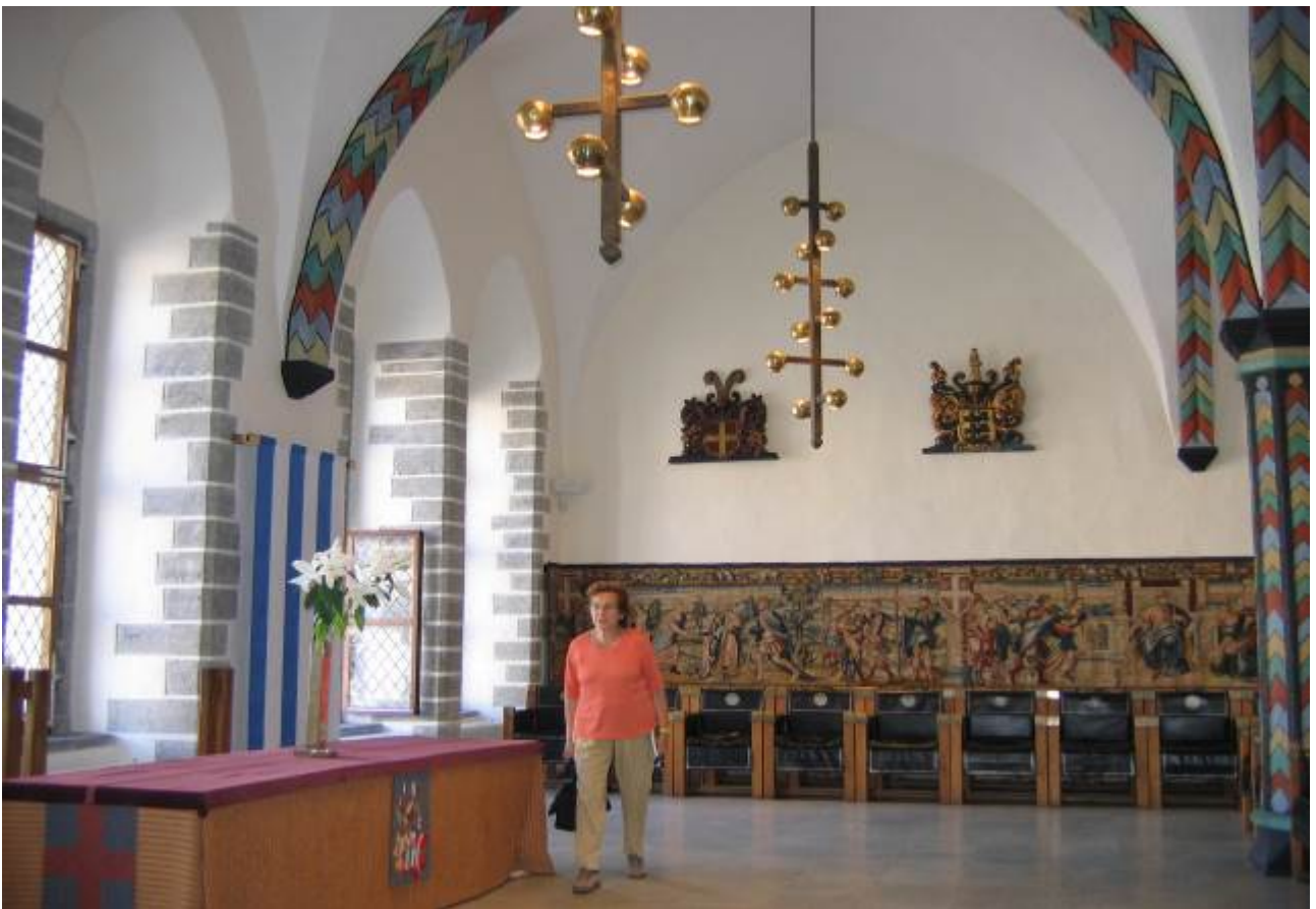
Al primo piano la sala delle assemblee civiche a due navate di tre campate su pilastri ottagonali. Sempre al primo piano la sala del Consiglio che serviva anche