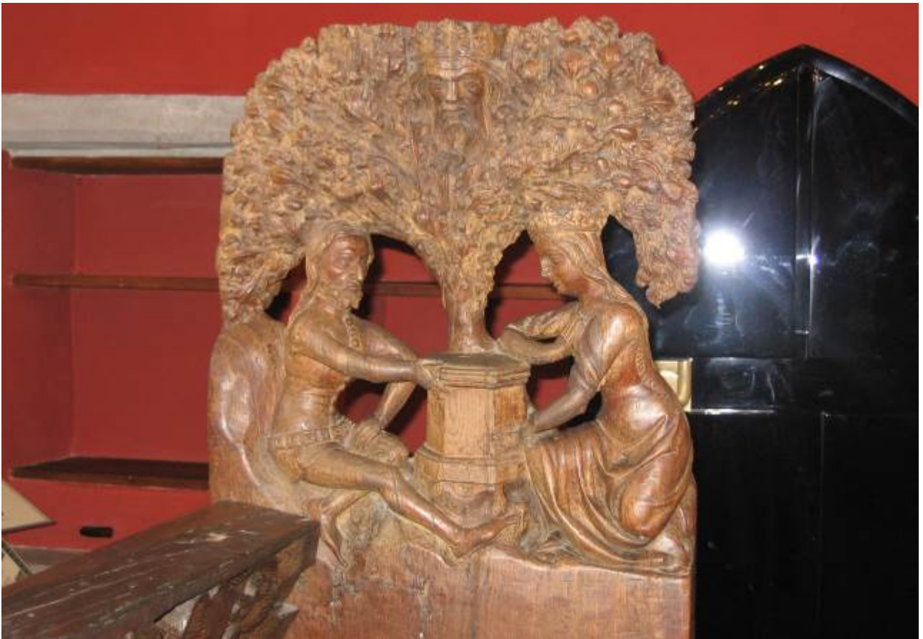
da corte di Giustizia. Banchi e seggi di legno intagliato originali, i braccioli rappresentano uno Tristano ed Isotta e l'altro Sansone e il leone.