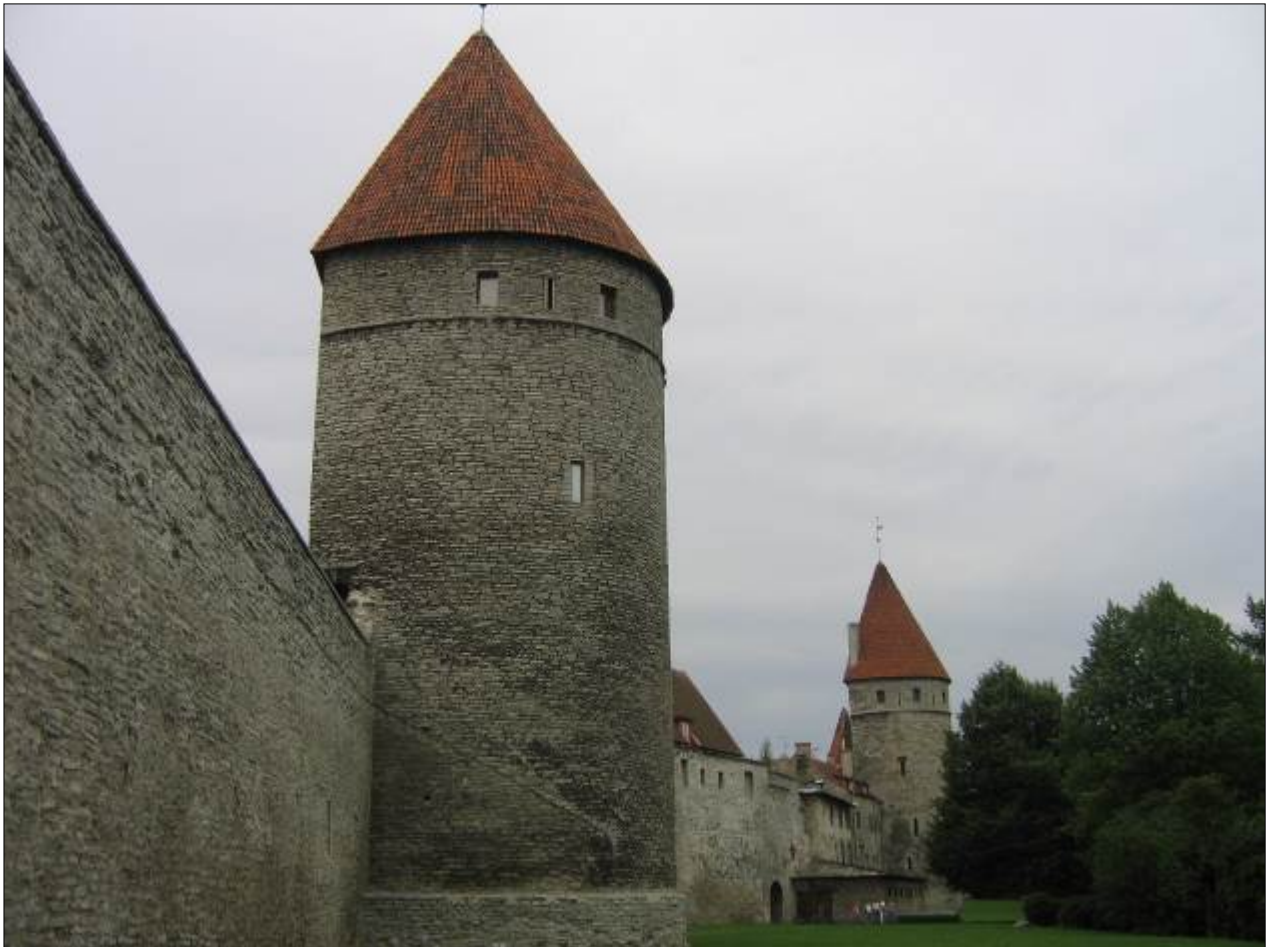
delle mura e ammirare le torri dall'esterno della cinta muraria.

Queste mura e questa fila di torri tonde, mezz tonde, quadrate sono uno spettacolo veramente insolito. Dopo la spettacolare fila di torri che prospettano su Laboratorium si arriva in Kooli dove da una porta si può uscire su un bel parco giardino fuori