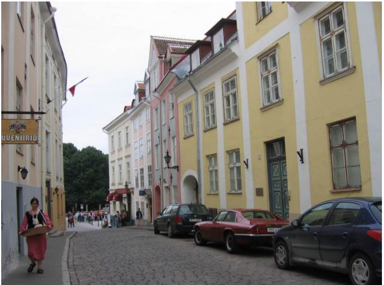
Tompea e si entra nel giardino del Parlamento e proprio dalla base di Pikk