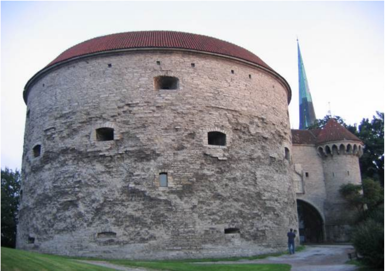
vicina. In albergo, in camera, TV, a letto.