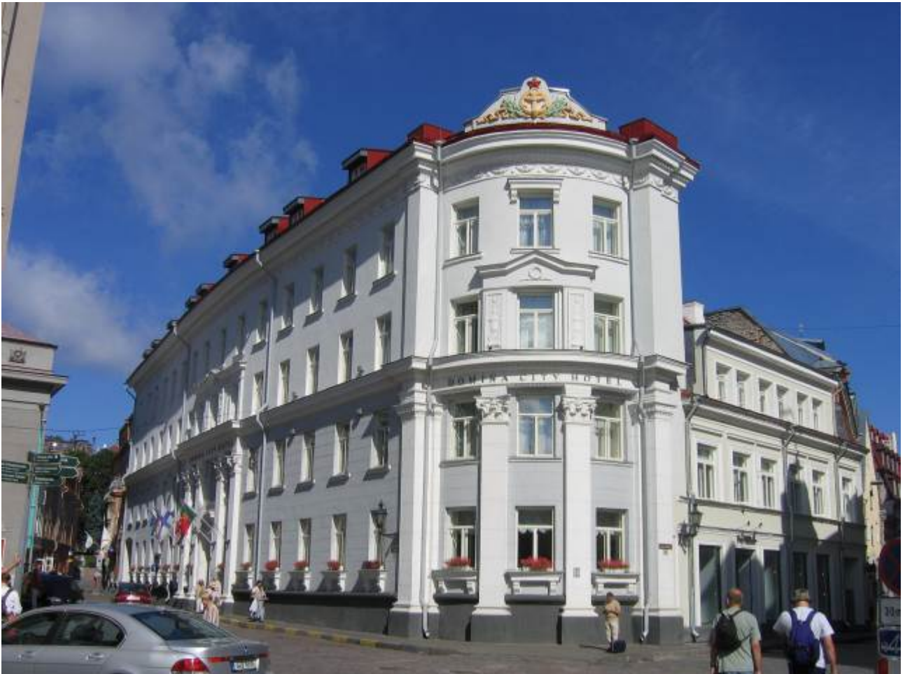
Oggi il palazzo accoglie l'Hotel Domina City. Rivediamo dal basso Kiek in de kok e le cupole della cattedrale Alexander Nevsky.