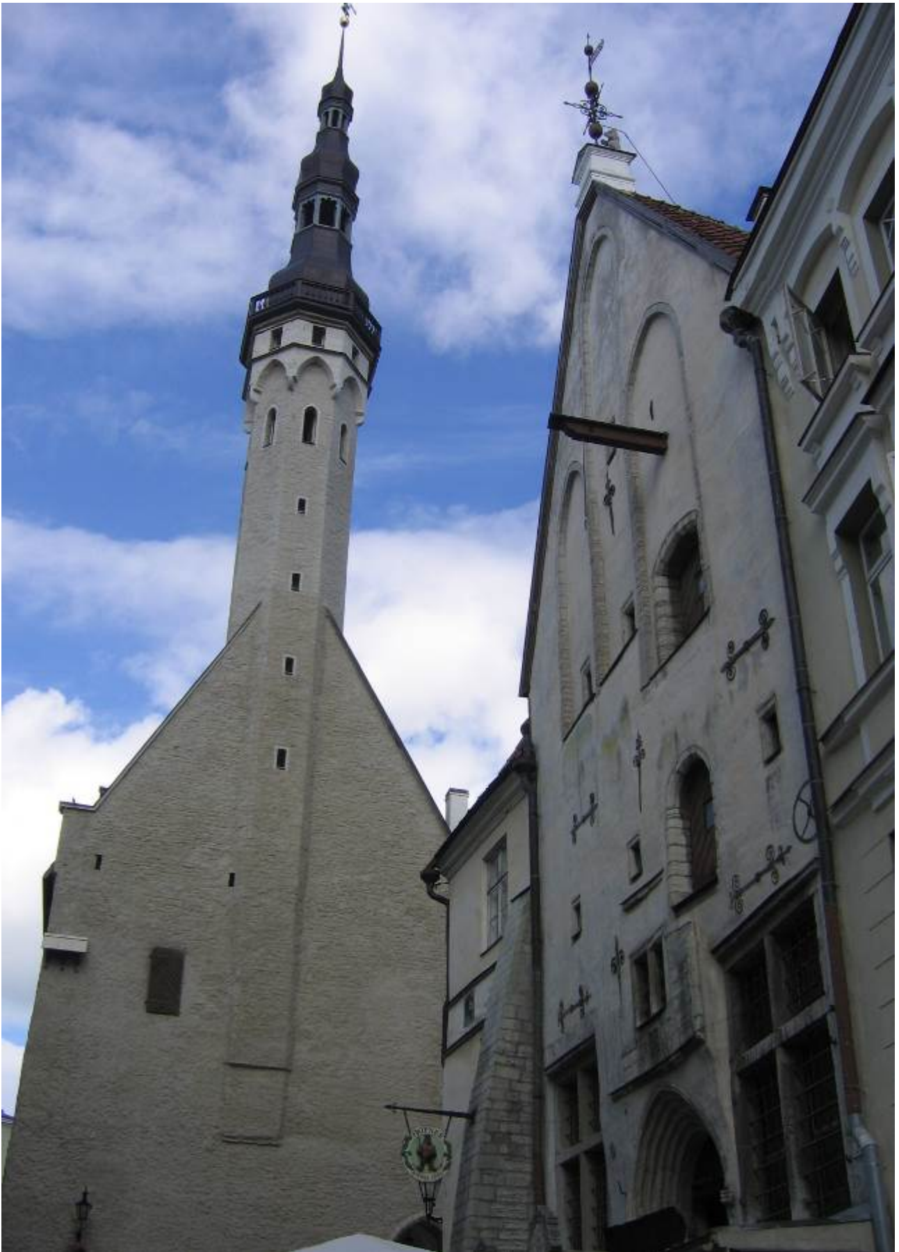
L'aspetto attuale risale al 1404 e in cima c'è la banderuola a forma di soldato nota come il vecchio Tommaso.