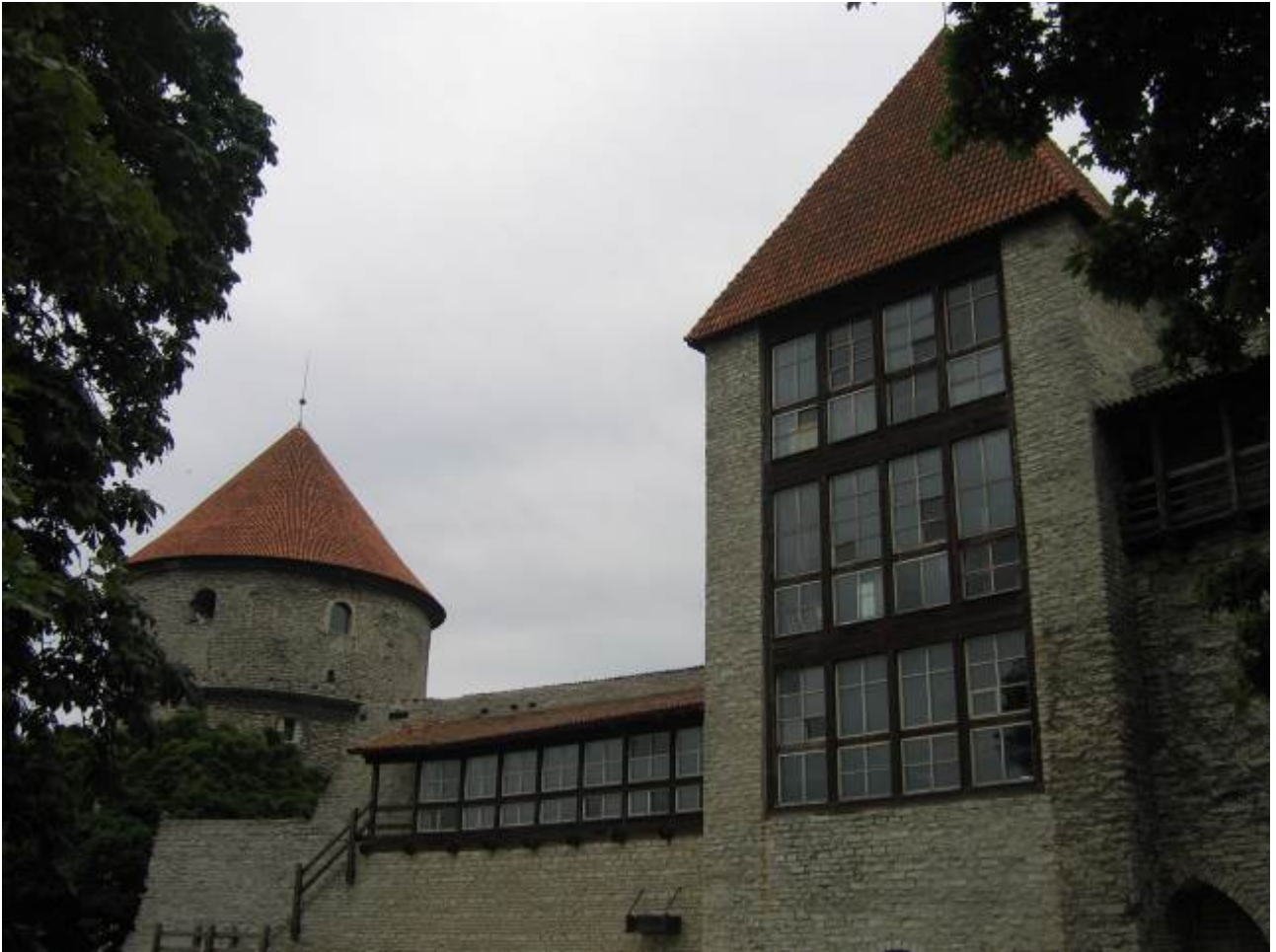
Kiek in de kok (una sbirciatina in cucina) e la torre delle vergini e guardiamo