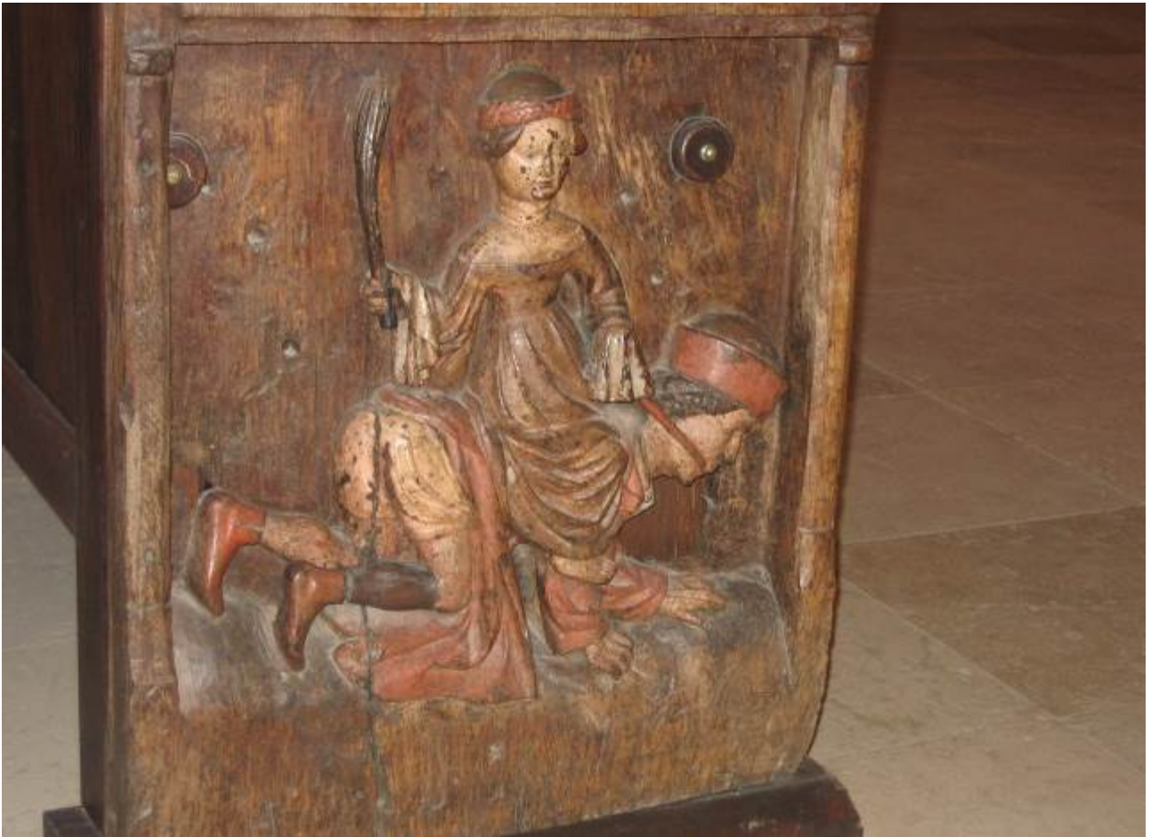
Uno strano intaglio definito Aristotile e Fillis dove lei frusta lui. Devo andare a vedere di cosa si tratta.