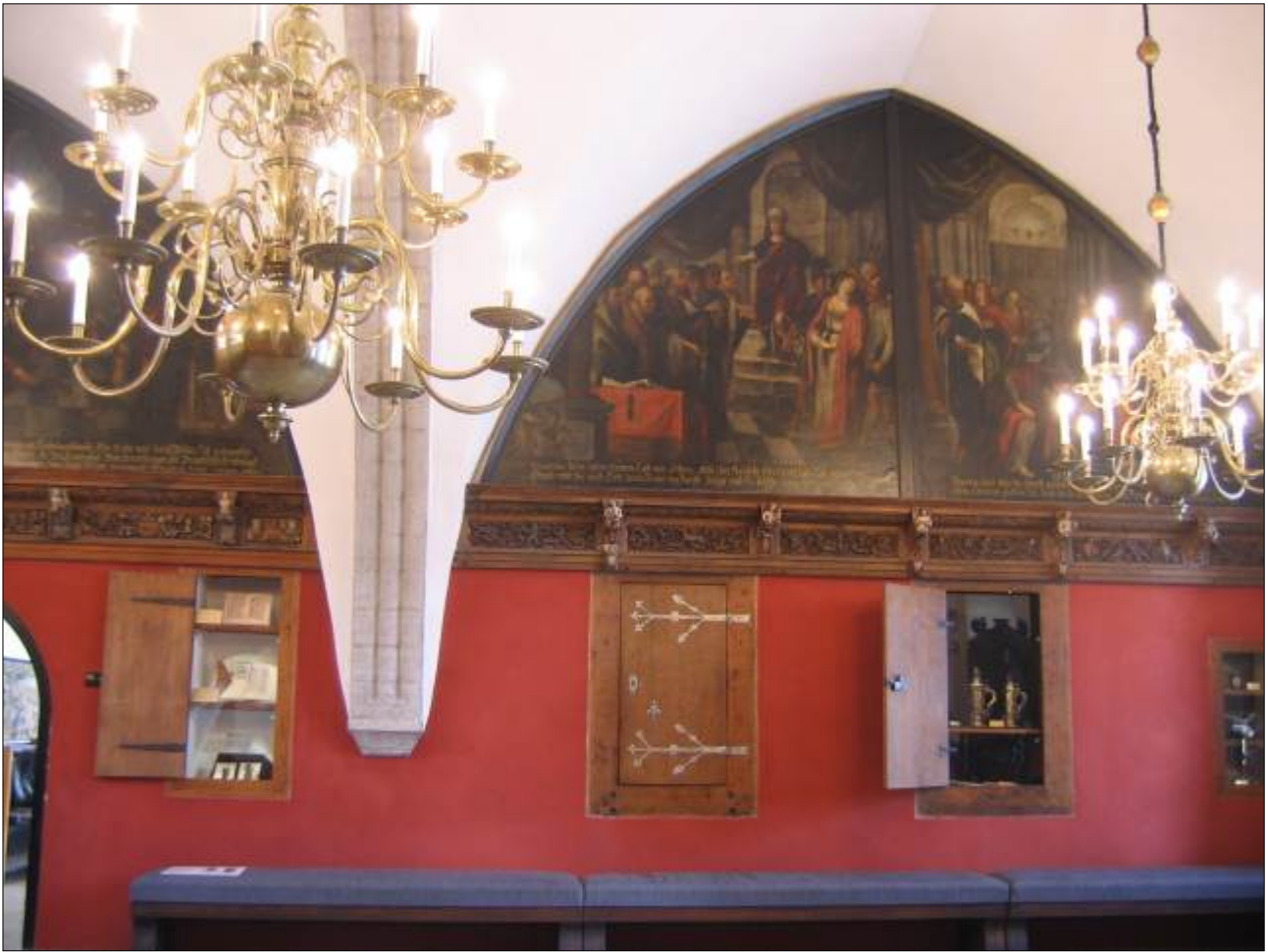
Molti affreschi, quadri, arazzi, argenti.